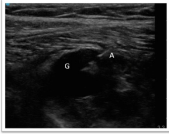
Figura 2. Ecografía en corte longitudinal de aspiración con aguja ecoguiada del ganglión. G: Ganglión. A: Aguja en interior de ganglión iniciando aspirado.

Figura 2. Ecografía en corte longitudinal de aspiración con aguja ecoguiada del ganglión. G: ganglión. A: aguja en interior de ganglión iniciando aspirado.