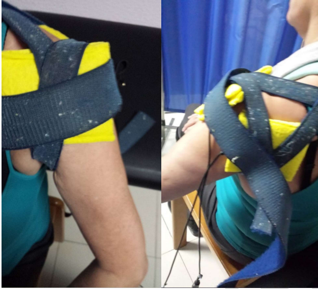
Figura 2. El catión (electrodo negativo) se aplica en la cara anterior del hombro (imagen anterior) mientras que el anión (electrodo positivo) se aplica a 10 cm de distancia, en la región posterior del hombro, sobre la fosa supraespinosa. Ambos electrodos se humedecen previamente y se ajustan con un velcro.