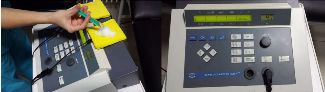
Figura 1. El ácido acético al 5 % (polaridad negativa) se vierte en una cantidad de 2 cc sobre una gasa de algodón sobre el catión (electrodo negativo). Para la iontoforesis, se aplica una corriente galvánica de 4,7 mA por 10 minutos.